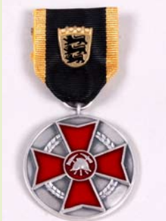
LFV Ehrenmedaille, Silber