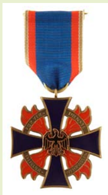
Deutsches Feuerwehr-Ehrenkreuz, Bronze