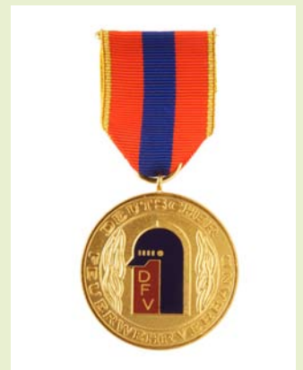
Medaille für internationale Zusammenarbeit, Gold