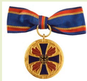
Deutsche Feuerwehr-Ehrenmedaille, Damen