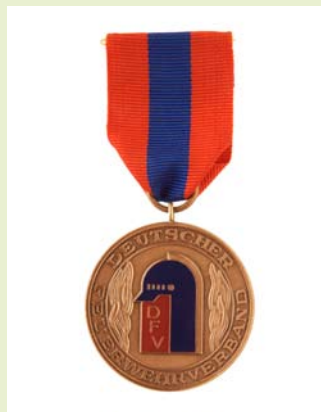
Medaille für internationale Zusammenarbeit, Bronze