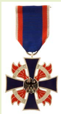
Deutsches Feuerwehr-Ehrenkreuz, Silber