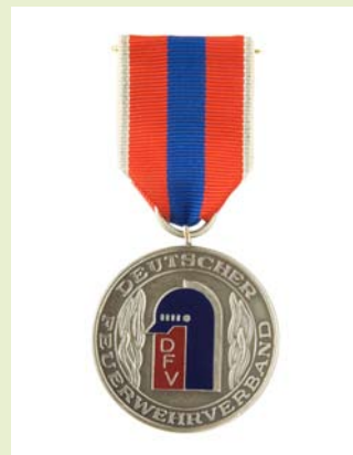
Medaille für internationale Zusammenarbeit, Silber