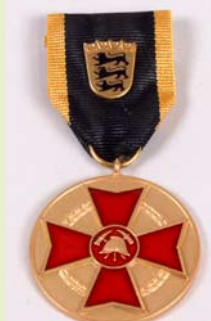
LFV Ehrenmedaille, Gold