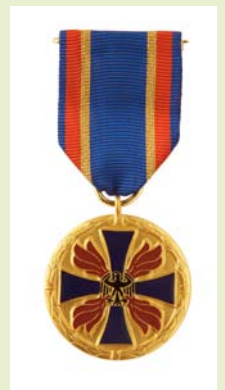
Deutsche Feuerwehr-Ehrenmedaille, Herren